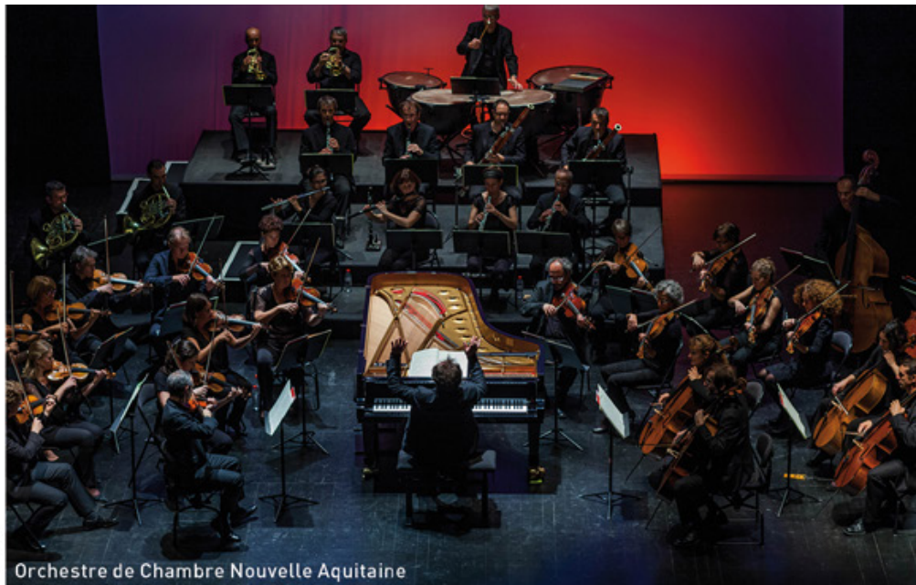
Orchestre de Chambre Nouvelle Aquitaine