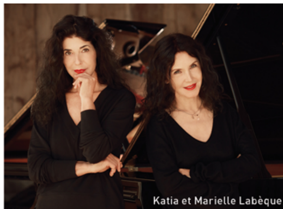
Katia et Marielle Labèque