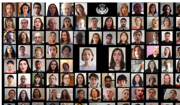
imagen del vídeo grabado por los orfeonistas durante la pandemia