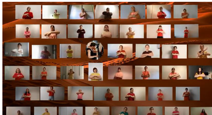
CONCIERTO FIN DE CURSO : Después de superar un curso de lo más atípico y experimentando por primera vez ensayos por video llamada, el 18 de junio los integrantes de los Pequeños Cantores, el Orfeoi Txiki y el Orfeoi Gazte realizaron un concierto online en Facebook Live, para mostrar el enorme trabajo realizado en este extraño curso.