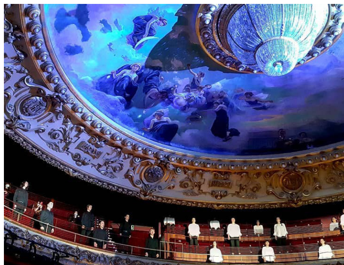
LEHEN KONTZERTUA: Lehen kontzertua ekainak 10 eskaini genuen; egun horretan, Orfeoi Gazteak berriro zapaldu zuten taula gaina, lehenbiziko aldian bezain urduri eta pozik; Victoria Eugenia Antzokiko sabaietik kantatu zuten, osasun langileen omenez.