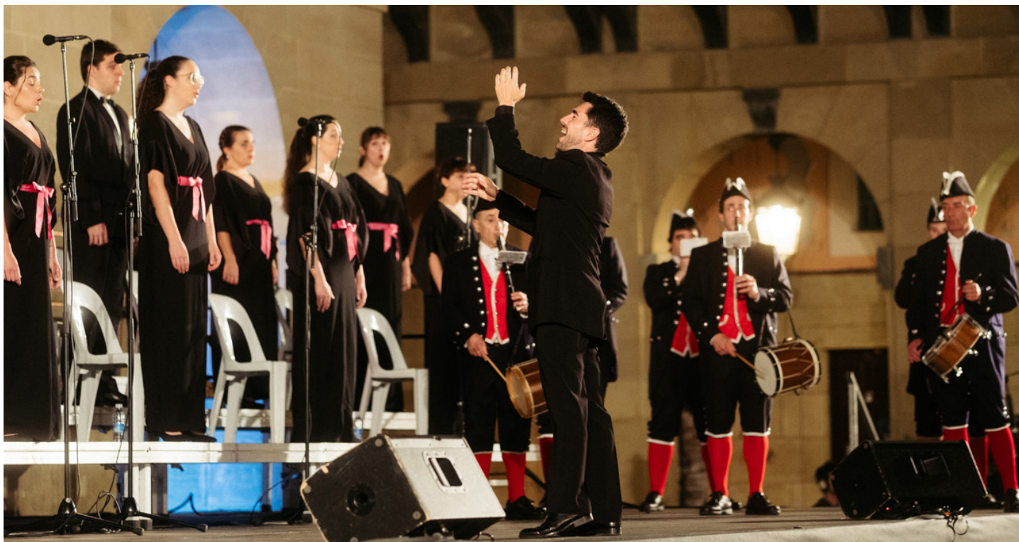
CONCIERTO VÍSPERA DE SAN JUAN: El 23 de junio participamos en el acto organizado por el Ayuntamiento y Donostiako Festak para celebrar la noche de San Juan y dar la bienvenida al solsticio de en plaza Constitución.