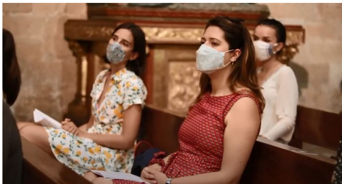
BUELTAN GARA - ESTAMOS DE VUELTA: Tras el paréntesis provocado por la crisis del coronavirus, el Orfeón Donostiarra celebró el 12 de junio su primer ensayo en la iglesia de San Vicente, siguiendo con escrúpulo los protocolos establecidos por las autoridades sanitarias y manteniendo en todo momento las distancias.