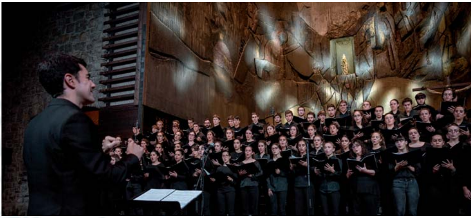
Orfeoi Gazteak, Bilboko Koral Elkarteko Euskera abesbatzarekin batera, Mende Berria Kantuz kontzertua eskaini zuen Arantzazu basilikan, urriaren 5ean. Euskaltzaindiaren mendeurrena ospatzeko ekitaldi nagusietako bat izan zen.