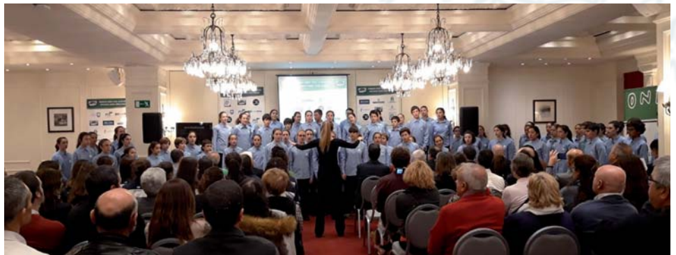
El Txiki dio brillo a la gala de entrega de premios de Onda Cero Gipuzkoa la noche del 22 de noviembre.