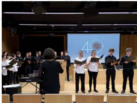
Las voces del Gazte pusieron el sonido en la conmemoración del 40 aniversario del Instituto Vasco de Criminología el 23 de noviembre.