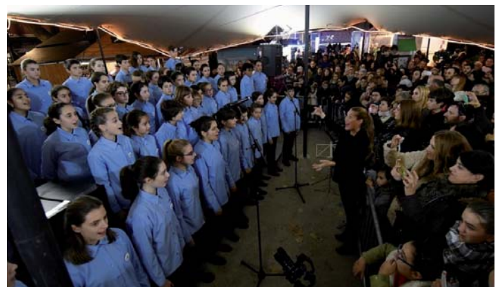
Orfeoi Txikiaren Gabon-kantak, hiriko Gabonetako argiak pizteko eta Frantzia pasealekuko Gabonetako merkatua inauguratzeko ekitaldian.