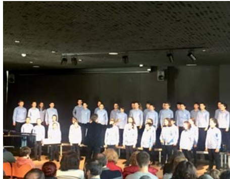
En el Museo Balenciaga de Getaria, la mañana del 15 de diciembre el Txiki obsequió con un concierto a quienes se acercaron para participar en el encuentro en torno a la festividad de Santa Lucía, patrona de las costureras.