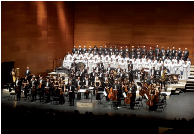
Bajo el título América canta, con éxitos de Latinoamérica y de aquí, se interpretó en el Kursaal el 27 de abril un concierto de temas variados con la Orquesta Clásica Santa Cecilia y el director Sainz Alfaro.