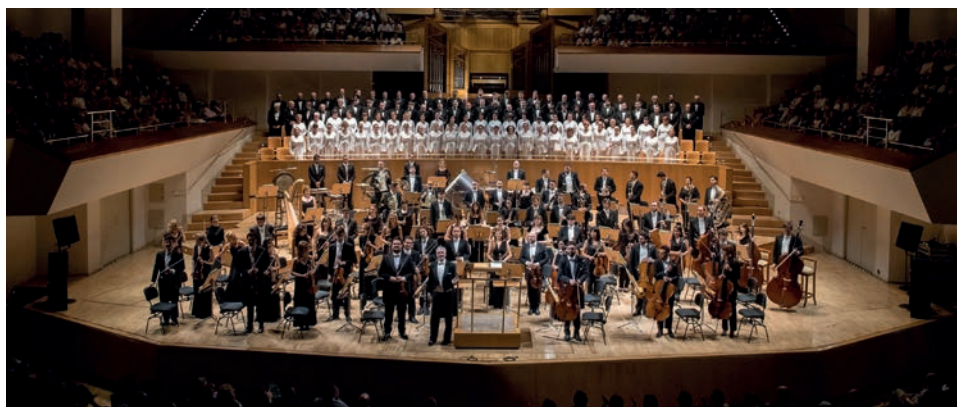
Auditorio Nacional.