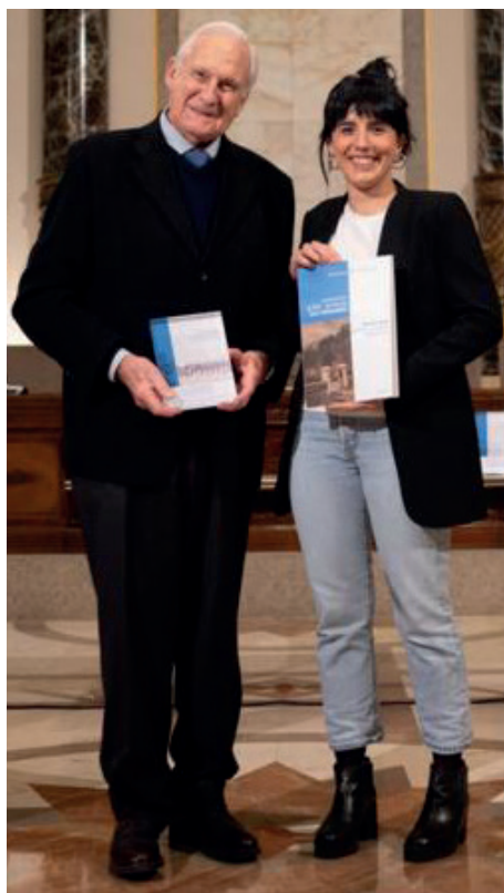
RECONOCIMIENTO POR 425 ANIVERSARIO DE LAS TAMBORRADAS